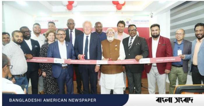
BANGLADESHI AMERICAN NEWSPAPER