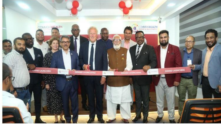
কমনওয়েলথ ট্রেড অ্যান্ড ইনভেস্টমেন্ট ফোরামের ঢাকায় লিয়াজোঁ অফিস উদ্বোধনে অতিথিরা।

কমনওয়েলথ এন্টারপ্রাইজ অ্যান্ড ইনভেস্টমেন্ট কাউন্সিলের (সিডব্লিউইআইসি) উদ্যোগে বাংলাদেশে বাণিজ্য ও বিনিয়োগ সম্ভাবনা বৃদ্ধির লক্ষ্যে ঢাকায় অফিস খুলেছে কমনওয়েলথ ট্রেড অ্যান্ড ইনভেস্টমেন্ট ফোরাম।