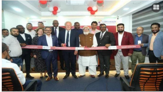
ঢাকায় অফিস খুলল কমনওয়েলথ ট্রেড অ্যান্ড ইনভেস্টমেন্ট ফোরাম।

কমনওয়েলথ এন্টারপ্রাইজ অ্যান্ড ইনভেস্টমেন্ট কাউন্সিলের (সিডরিউইআইসি) উদ্যোগে বাংলাদেশে বাণিজ্য ও বিনিয়োগ সম্ভাবনা বৃদ্ধির লক্ষ্যে ঢাকায় অফিস খুলেছে কমনওয়েলথ ট্রেড অ্যান্ড ইনভেস্টমেন্ট ফোরাম। মঙ্গলবার (১২ সেপ্টেম্বর) ঢাকার বারিধারা জে ব্লকে লিয়াজৌ অফিস উদ্বোধন করেন সিডরিউইআইসি চেয়ারম্যান লর্ড মারল্যান্ড এবং প্রধানমন্ত্রীর বেসরকারি শিল্প ও বিনিয়োগ উপদেষ্টা সালমান এফ রহমান।