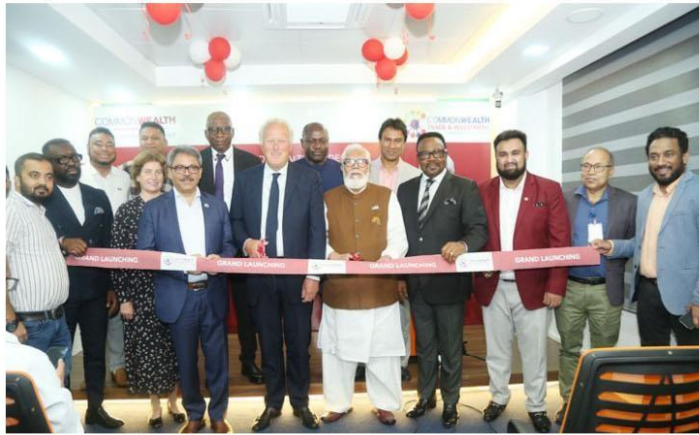
ঢাকায় অফিস খুললো কমনওয়েলথ ট্রেড অ্যান্ড ইনভেস্টমেন্ট ফোরাম

কমনওয়েলথ এন্টারপ্রাইজ অ্যান্ড ইনভেস্টমেন্ট কাউন্সিলের (সিডব্লিউইআইসি) উদ্যোগে বাংলাদেশে বাণিজ্য ও বিনিয়োগ সম্ভাবনা বৃদ্ধির লক্ষ্যে ঢাকায় অফিস খুলেছে কমনওয়েলথ ট্রেড অ্যান্ড ইনভেস্টমেন্ট ফোরাম।