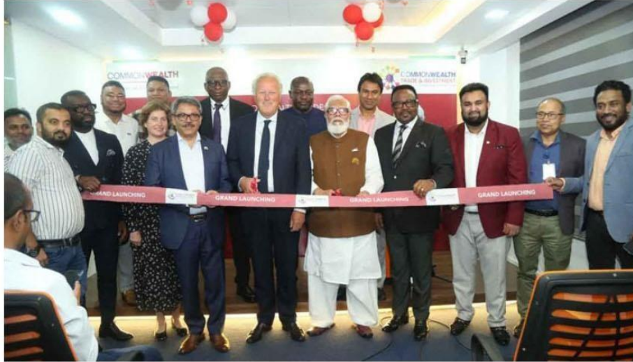
বারিধারায় লিয়াজেঁ অফিস উদ্বোধন

বাংলাদেশে বাণিজ্য ও বিনিয়োগ সম্ভাবনা বাড়াতে ঢাকায় অফিস খুলেছে কমনওয়েলথ ট্রেড অ্যান্ড ইনভেস্টমেন্ট ফোরাম। মঙ্গলবার ঢাকার বারিধারায় এই লিয়াজেঁ অফিস উদ্বোধন করেন কমনওয়েলথ এন্টারপ্রাইজ অ্যান্ড ইনভেস্টমেন্ট কাউন্সিলের (সিডব্লিউইআইসি) চেয়ারম্যান লর্ড মারল্যান্ড এবং প্রধানমন্ত্রীর বেসরকারি শিল্প ও বিনিয়োগবিষয়ক উপদেষ্টা সালমান এফ রহমান। এ সময় পররাষ্ট্র প্রতিমন্ত্রী মো. শাহরিয়ার আলম ও সিডব্লিউইআইসির বিভিন্ন দেশের নেতারা উপস্থিত ছিলেন।