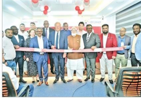
কনীতে উদ্বোধন হয়েছে কমনওয়েলথ ট্রেড অ্যান্ড ইনভেস্টমেন্ট ফোরামের ঢাকা কার্যালয় ● সংগৃহীত

Date:13-09-2023 Page:02 Col:1-3 Size:12 Col*inc