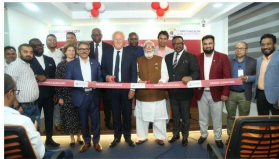
CWEIC Chairman Lord Marland and Prime Minister's Advisor Salman F Rahman inaugurated the liaison office in Baridhara J Block in Dhaka on Tuesday (12 September).

Commonwealth Trade and Investment Forum, an initiative of the Commonwealth Enterprise and Investment Council (CWEIC), has opened an office in Dhaka to facilitate trade and investment in Bangladesh.